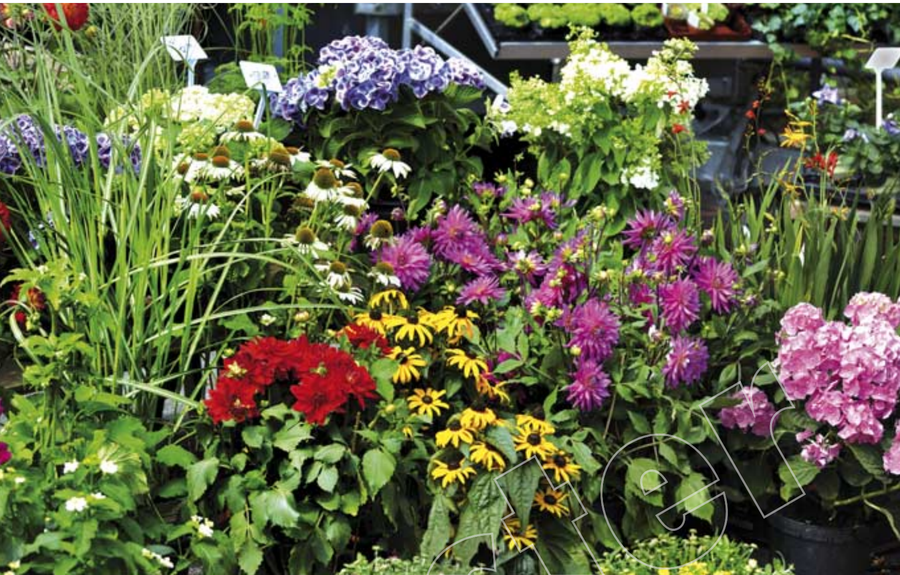
Der Duft des Sommers