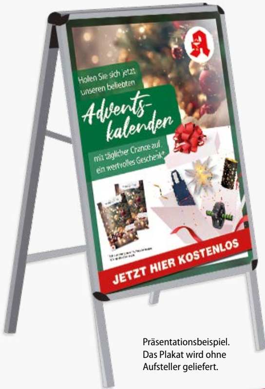
Präsentationsbeispiel. Das Plakat wird ohne Aufsteller geliefert.

Diese Werbemittel erhalten Sie kostenfrei!