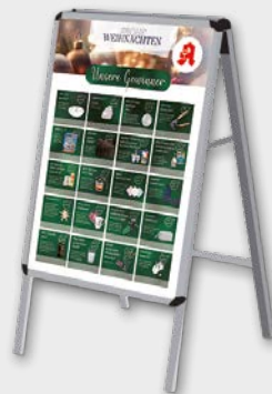
Präsentationsbeispiel. Das Plakat wird ohne Aufsteller geliefert.

Passend zum Design der Adventskalender, bei denen Ihre Kunden einen Gutschein erhalten.